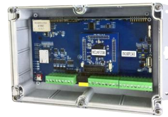
IP66 防水型 壁掛